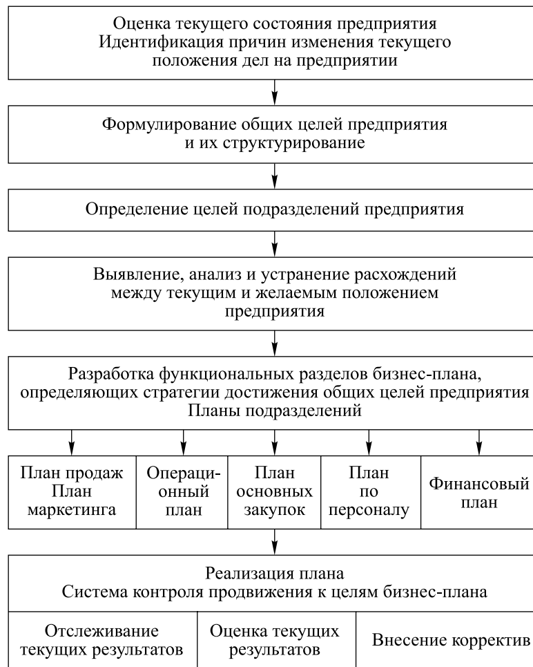
Рис. 2. Общий алгоритм разработки и реализации управленческого бизнес-плана

На основе общей цели (или целей) предприятия определяются частные цели структурных подразделений, которые конкретизируют их задачи. Основным моментом здесь является смещение внимания с автономно работающего подразделения на понимание общей цели предприятия. На малых (средних) предприятиях это достигается гораздо легче, чем на крупных.