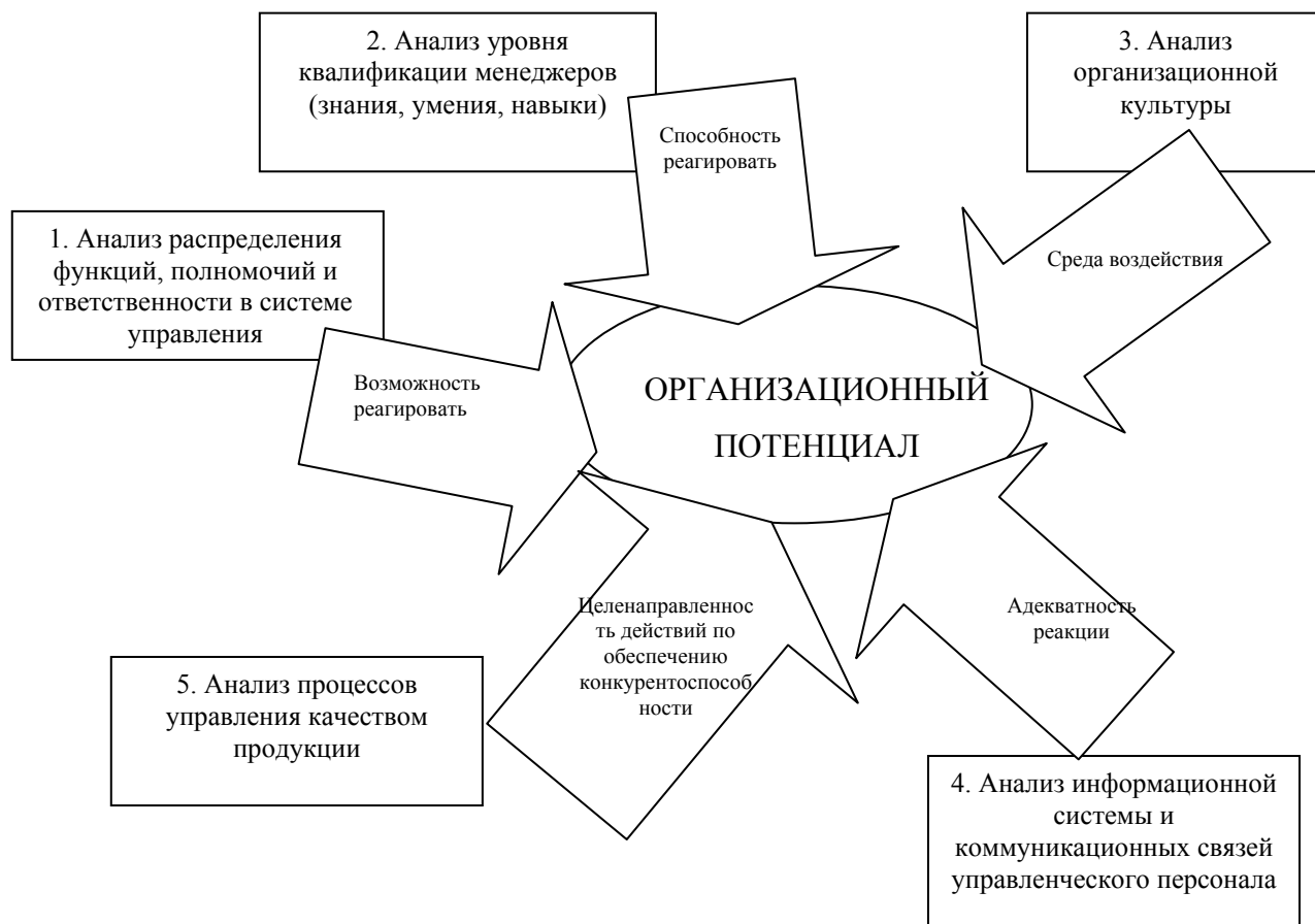
Рис. 5. Методика анализа организационного потенциала предприятия

организационного климата, исследование информационной системы и коммуникационных связей персонала организации и анализ процессов управления качеством (рис.5).