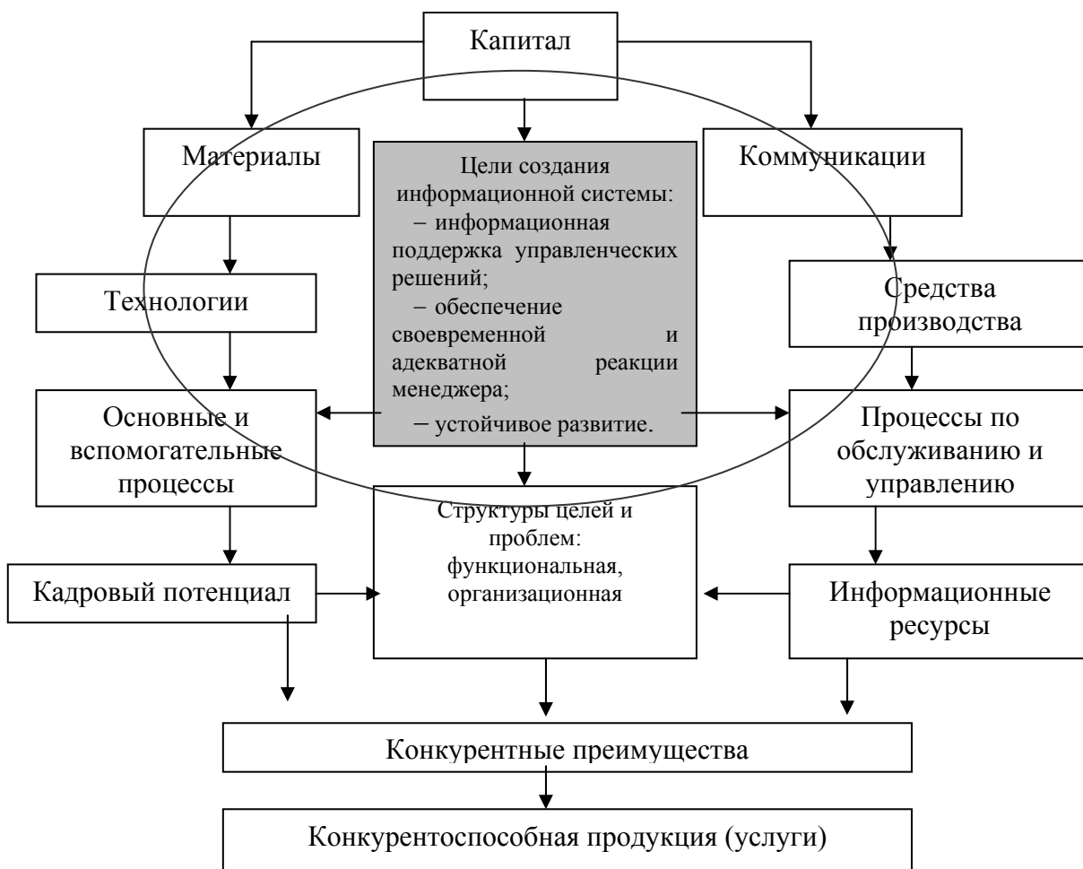
Рис. 3. Ключевые элементы формирования информационной системы организационного потенциала

производства и обслуживания производственных операций, коммуникационную систему и кадровый потенциал.