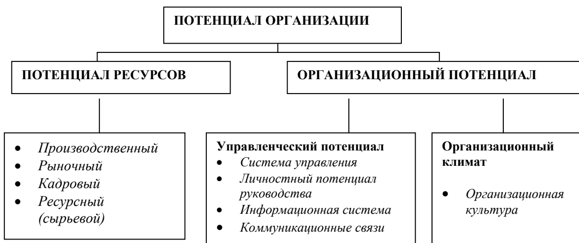
Рис. 1. Структура потенциала организации

Такая двойственность взаимодействия позволяет выделить группу показателей оценки эффективности их использования (таблица 1). Состояние потенциала ресурсов может зависеть от организационных механизмов и конкретных рычагов воздействия на ресурсы. Такие зависимости наблюдаются и в организационном потенциале (организационный потенциал составляют управленческий потенциал и организационный климат).