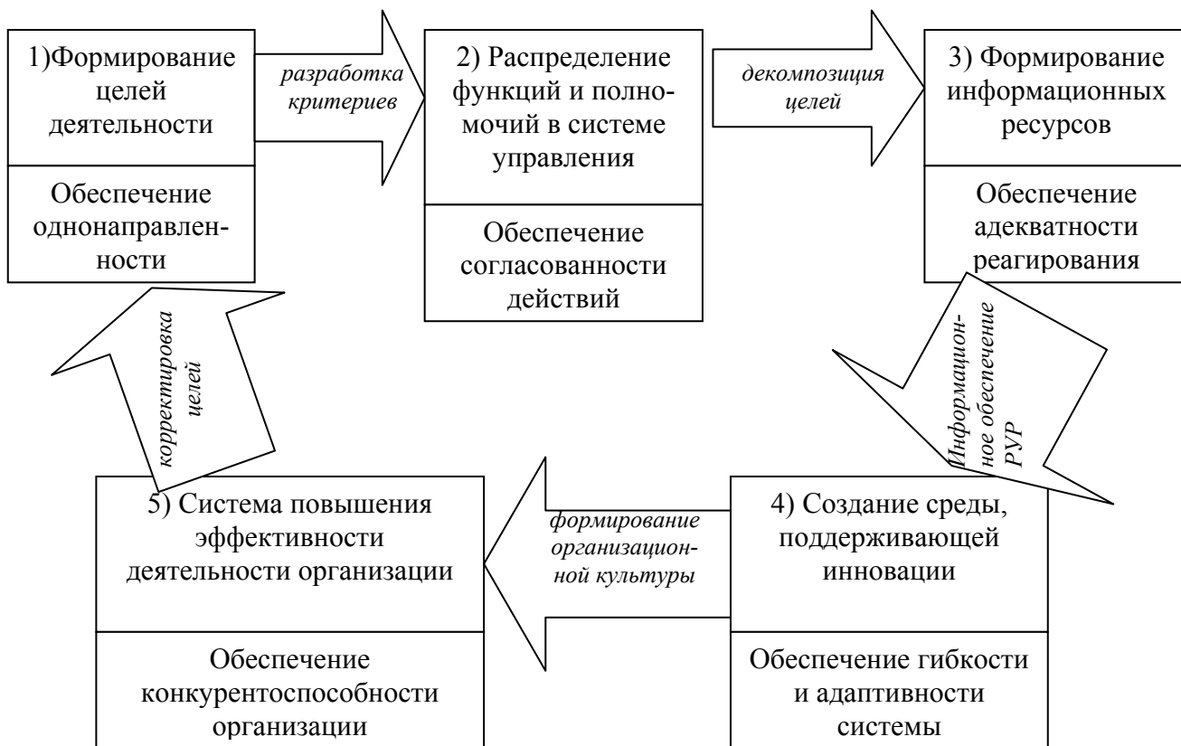
Рис.2. Цикл формирования организационного потенциала

Процесс формирования организационного потенциала можно разделить на несколько этапов. В каждом конкретном случае, порядок их осуществления, временная протяженность каждого этапа могут отличаться, но в общем виде этот процесс может быть представлен следующим образом (рис. 2).