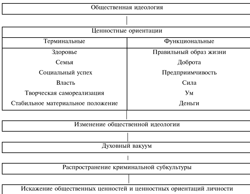
Рис. 2. Ситуационные факторы распространения криминальной субкультуры

Выборка, используемая в исследовании: целенаправленная, гнездовая.