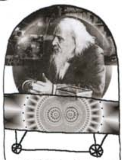
Д.И. Менделеев Толковый тариф, или Исследование о развитии промышленности России и в связи с ее общим таможенным тарифом 1891 года